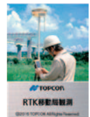
RTK 移動局観測 (FC-500) (近日発売)