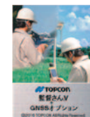
監督さん.V+ GNSS オプション*1 (FC-500)