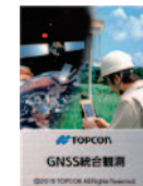
GNSS 統合観測 (FC-500) (近日発売)